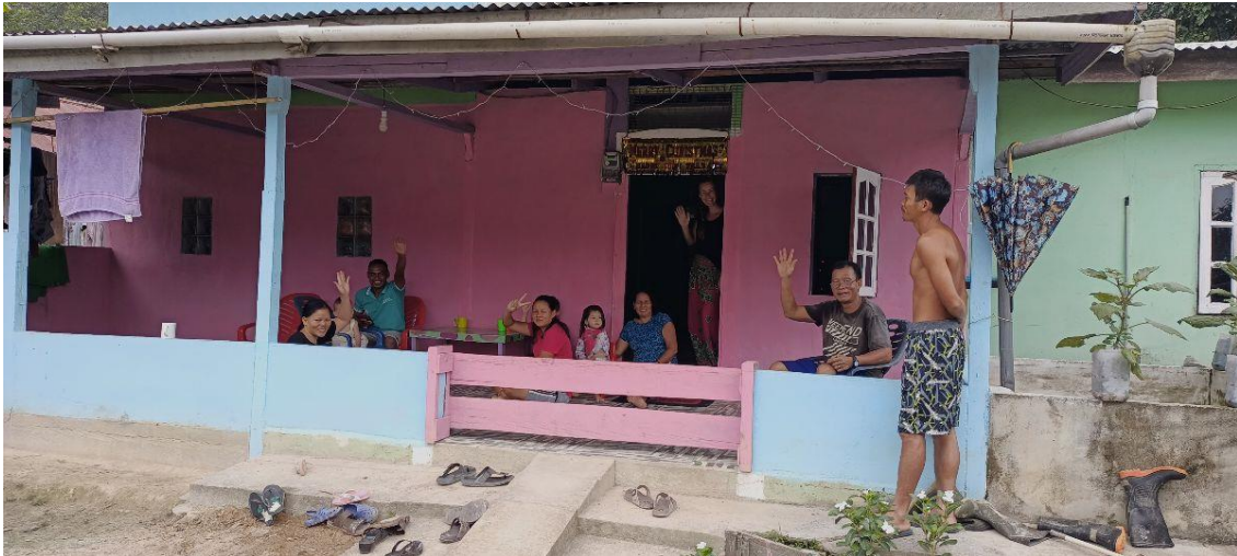
Hallo Gemeenteleden , een warme kerstgroet vanuit Kojub